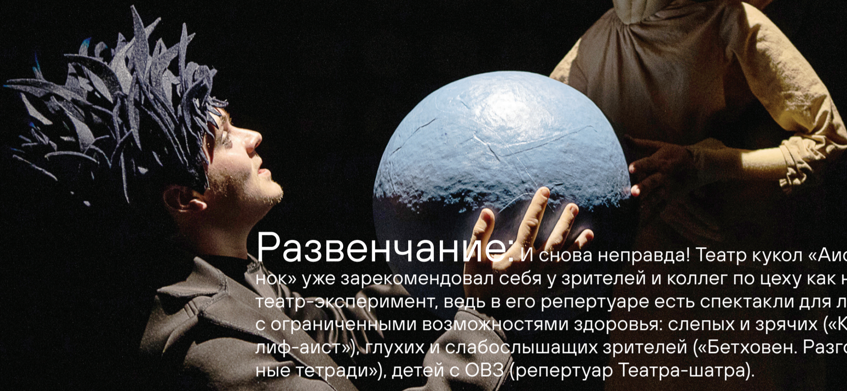
ФОТО ИЗ СПЕКТАКЛЯ «БЕТХОВЕН. РАЗГОВОРНЫЕ ТЕТРАДИ» В 2020 ГОДУ СПЕКТАКЛЬ УДОСТОЕН ПРЕМИИ ГУБЕРНАТОРА ИРКУТСКОЙ ОБЛАСТИ ТВОРЧЕСКИМ РАБОТНИКАМ ЗА ДОСТИЖЕНИЯ В ОБЛАСТИ КУЛЬТУРЫ И ИСКУССТВА.

Развенчание: И снова неправда! Театр кукол «Аистёнок» уже зарекомендовал себя у зрителей и коллег по цеху как некий театр-эксперимент, ведь в его репертуаре есть спектакли для людей с ограниченными возможностями здоровья: слепых и зрячих («Калиф-аист»), глухих и слабослышащих зрителей («Бетховен. Разговорные тетради»), детей с ОВЗ (репертуар Театра-шатра).